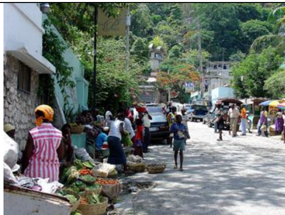
Pétion-Ville, marché de rue