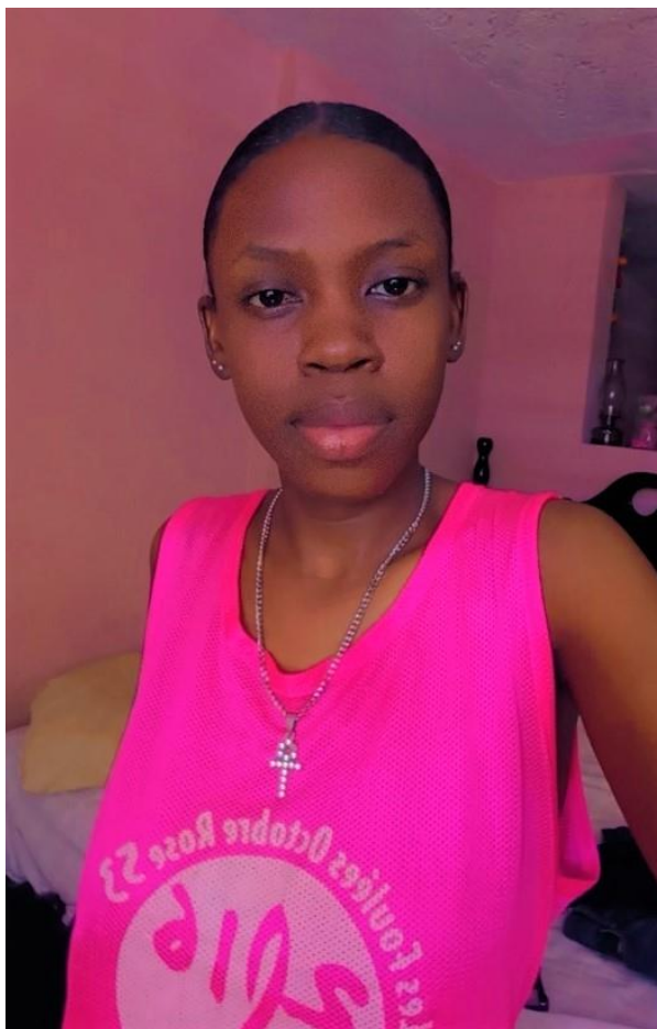
Redorah en 1ere