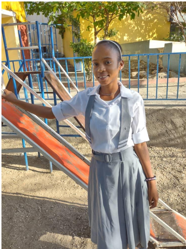
et sa sœur Neiba en classe de 1ere