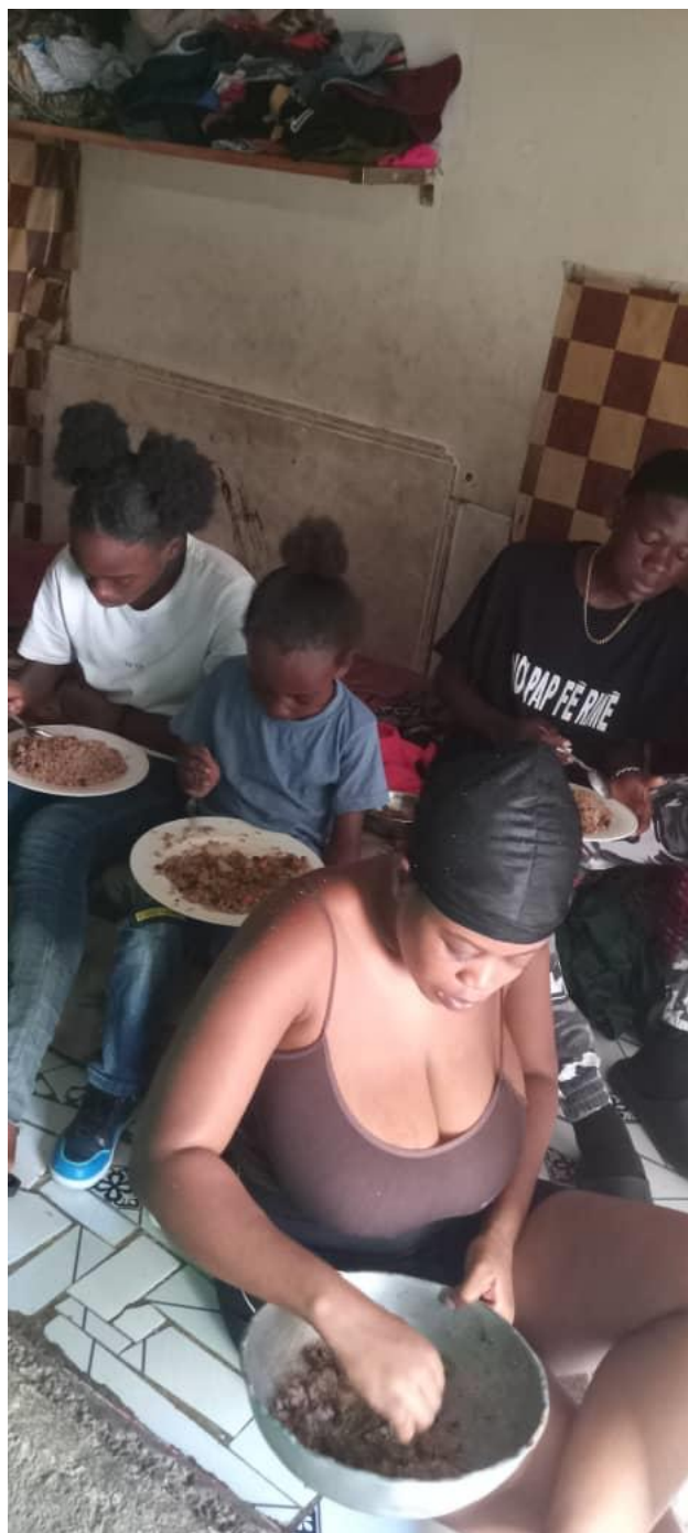
Repas en famille