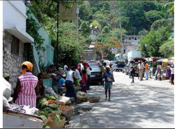
Pétion-Ville, marché de rue